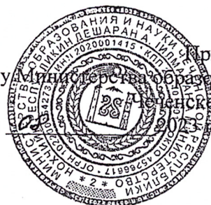
ГРАФИК проведения всероссийской олимпиады школьников в Чеченской Республике в 2023/2024 учебном году

Приложение № 1 к приказу Министерства образования и науки Чеченской Республики от «18» 09 2023 г. № 1092-п